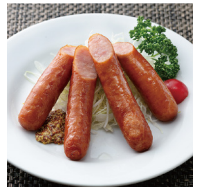
ジャンボウインナー