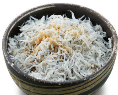
ミニ釜揚げちりめん丼