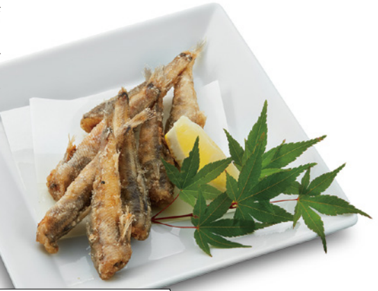
めひかりの唐揚げ

酒の肴にぴったり！ 土佐名物魚の「めひかり」。 あっさりなのに 脂ののった旨みが絶品。