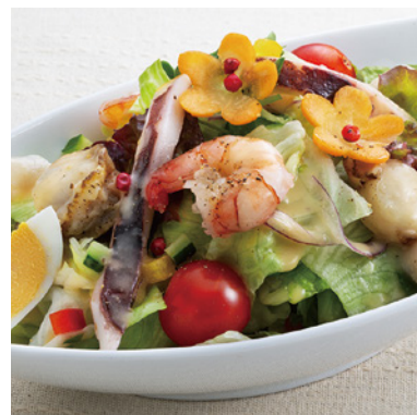
シーフードサラダ