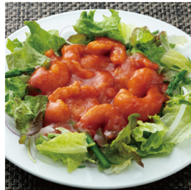
小エビのチリソース